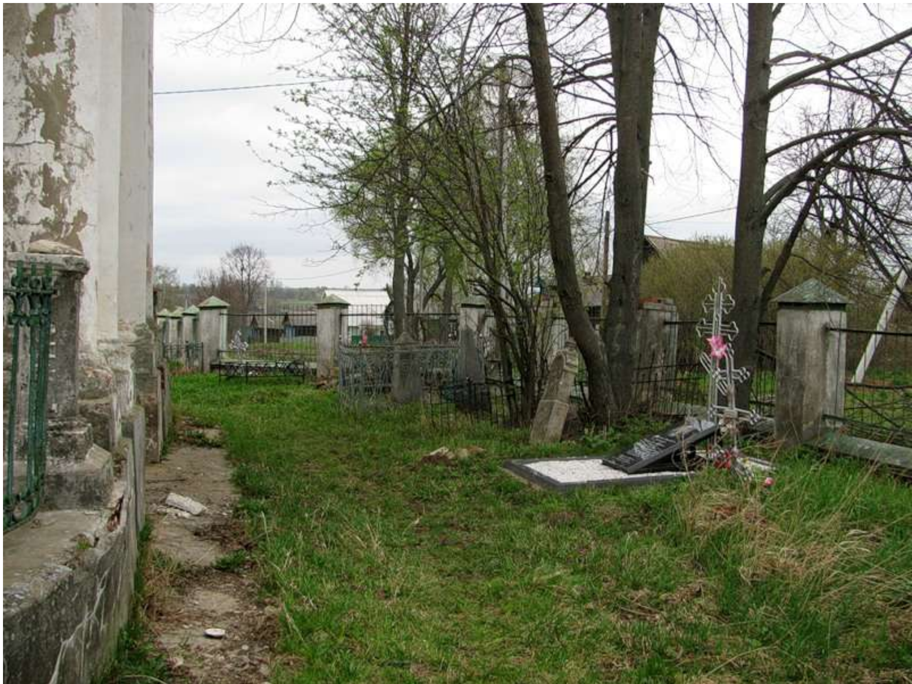
Храмоздатель похоронен у алтаря храма