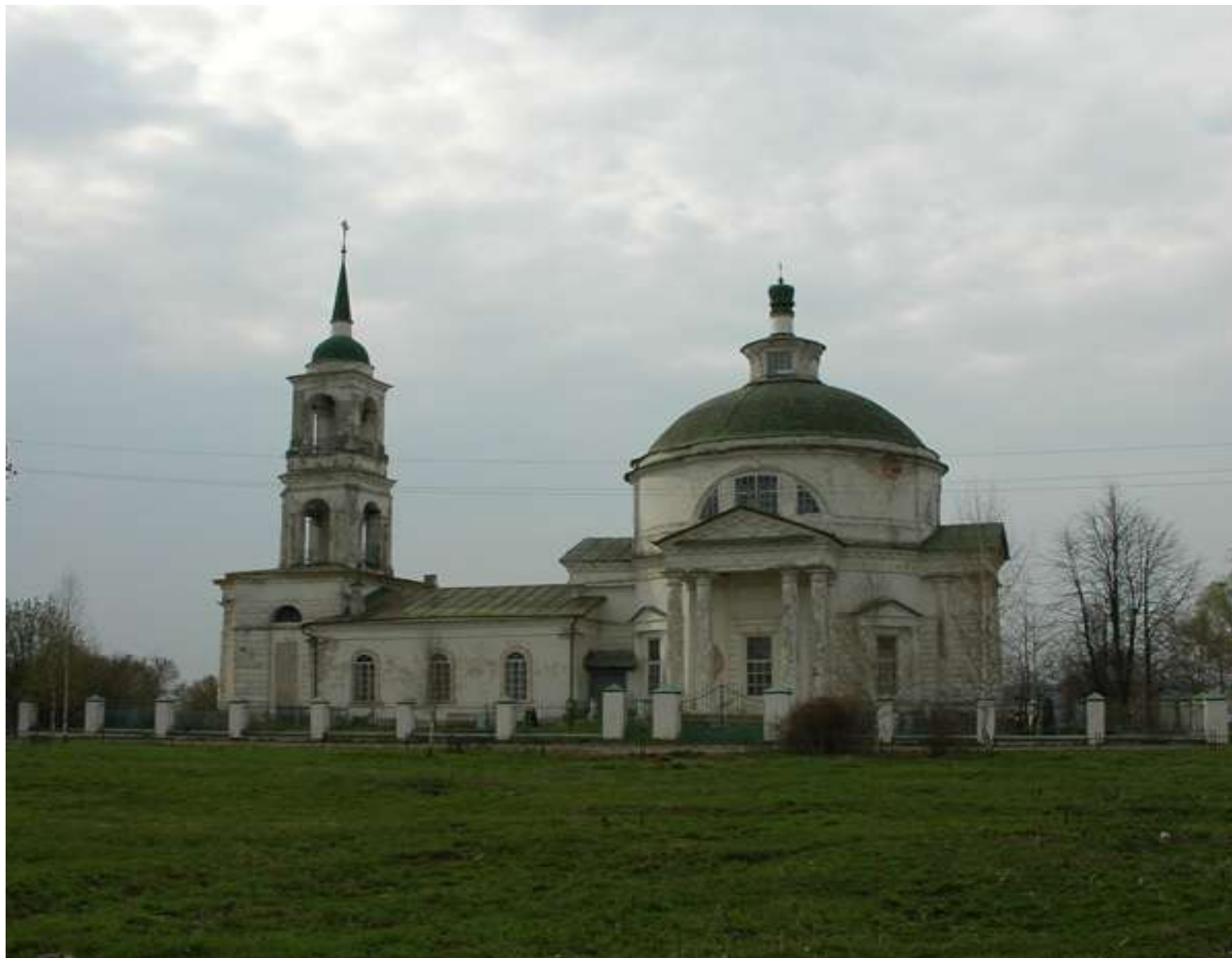
Сергиевский храм села Татищев-Погост