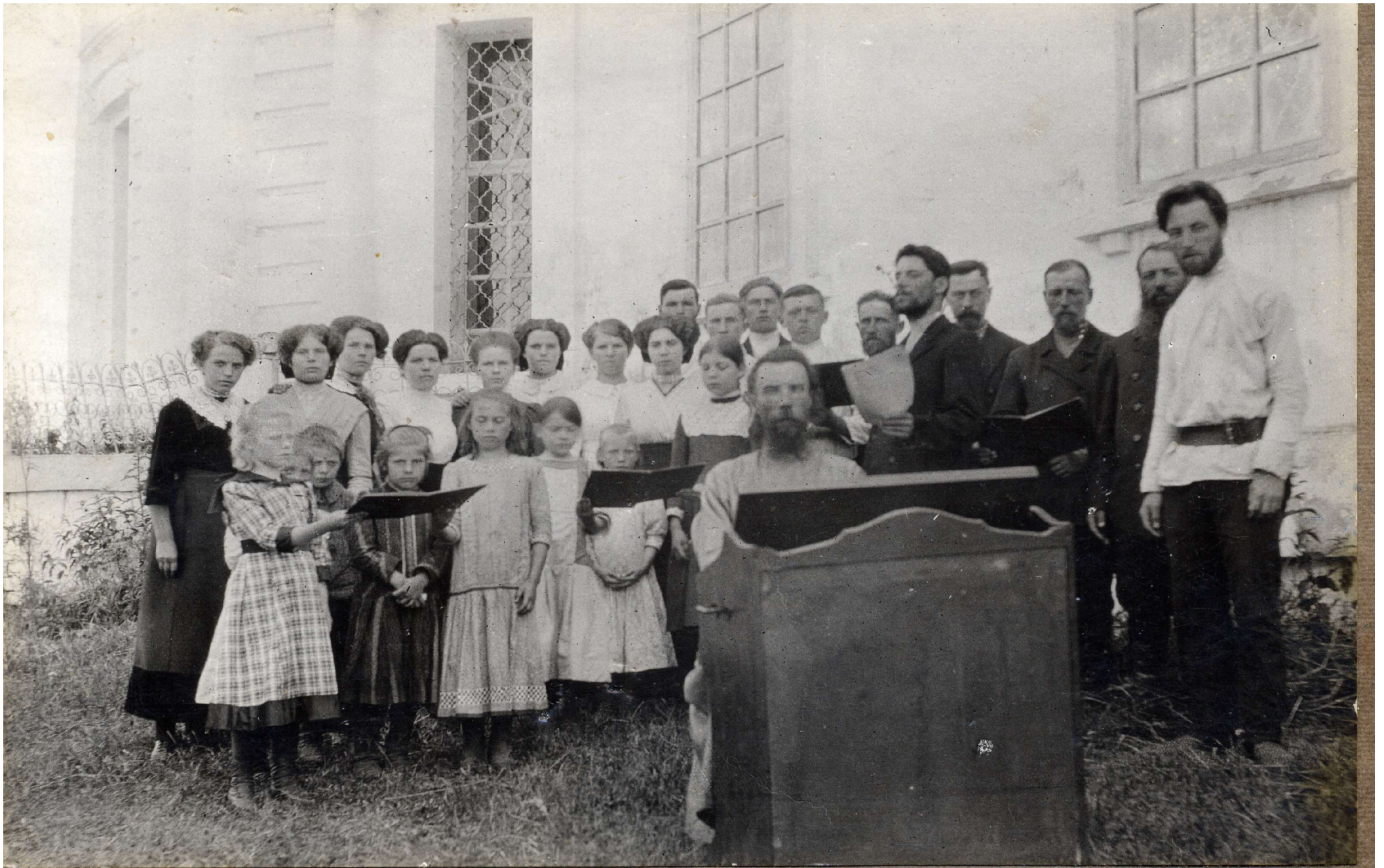
Церковный хор села Татищев-Погост