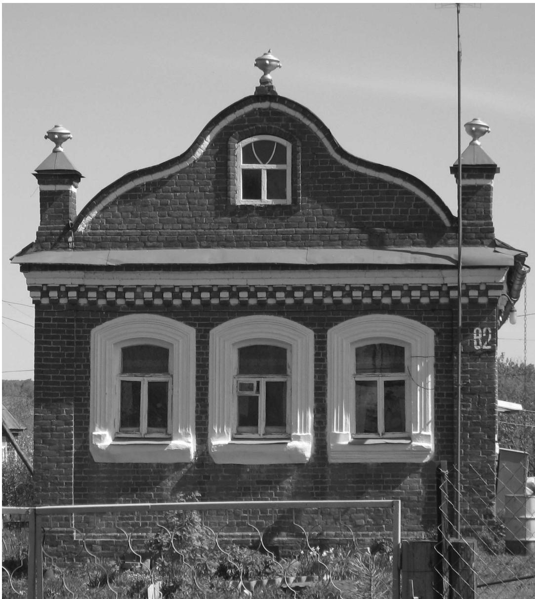
Образцовый дом села Татищев-Погост. Таковыми домами предполагал граф Д.П. Татищев застроить все село после пожара 1832 г.