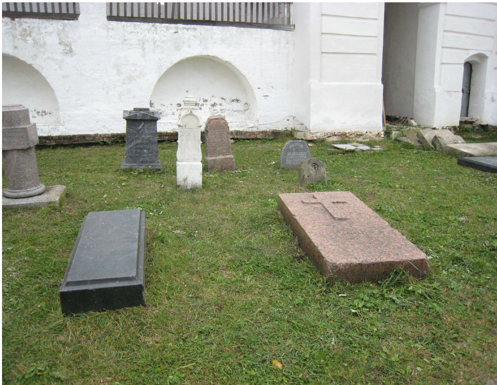
Надгробная плита — рядом со входом на колокольню Спасо-Яковлевского монастыря