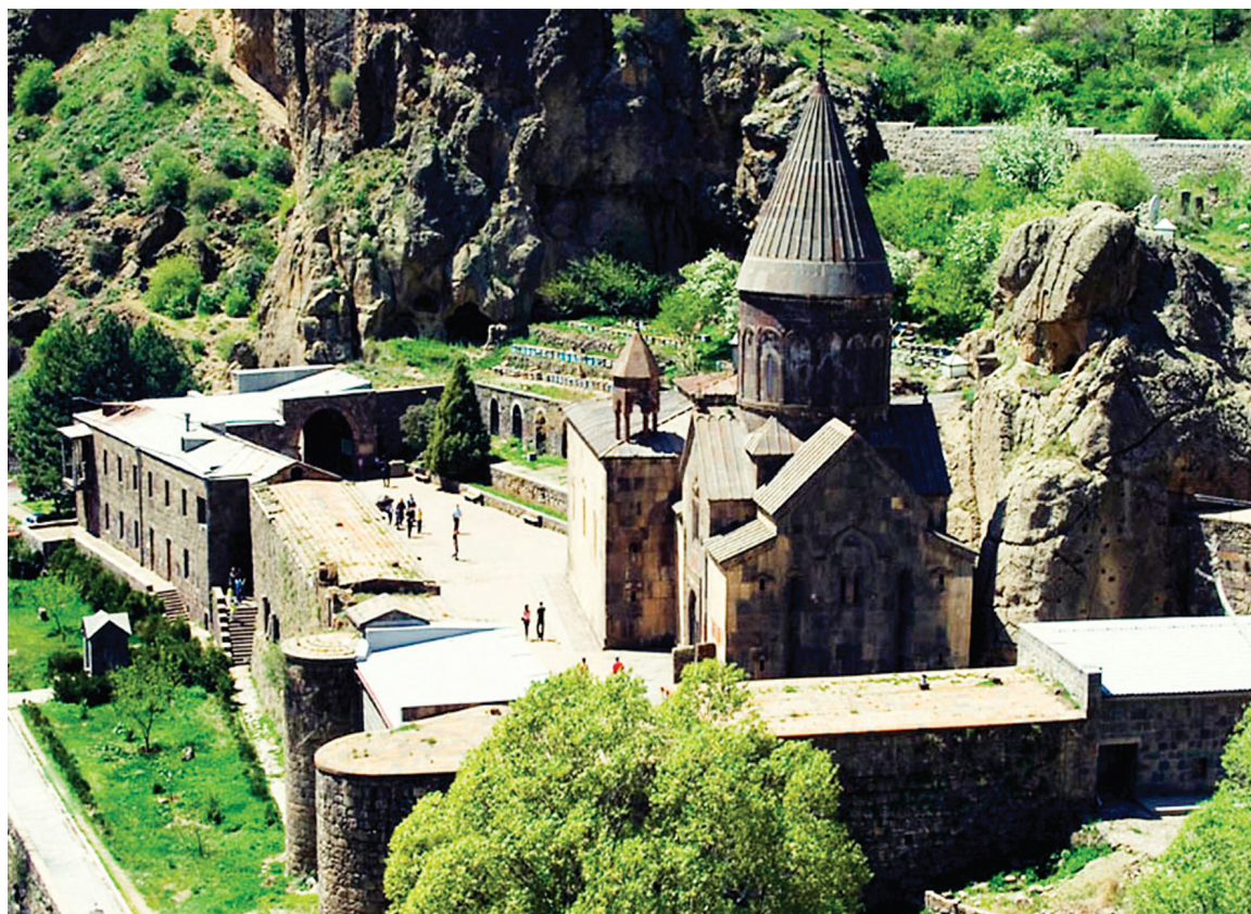
Монастырский комплекс Гегард