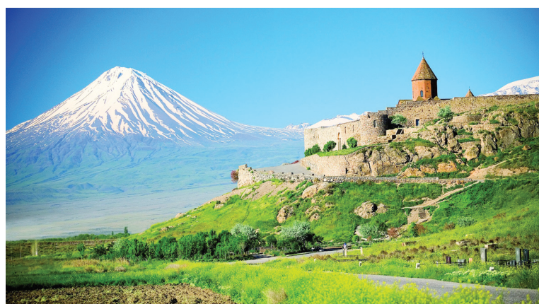
Вид на Арарат

Эта часть стояла здесь с 1828 года - со времен победного завершения русско-персидской войны. В советские годы храм был закрыт и использовался в качестве склада, а затем - полкового клуба, и вновь открылся в 1991 году, а девять лет спустя был восстановлен в первоначальном виде. Старый Покровский храм Еревана, переделанный в XIX веке из мечети, в советское время был полностью разрушен.