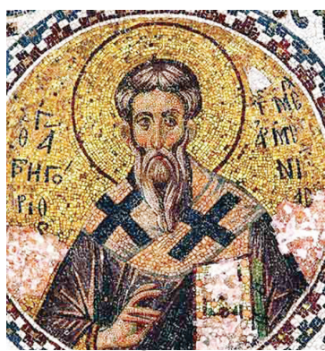
Святой Григорий, просветитель Армении

сти, в равной степени характерные восточнославянской и армянской культурам. Именно верность христианской традиции и ее нравственным идеалам является для нас связующей нитью, залогом нашего соработничества и дружбы».