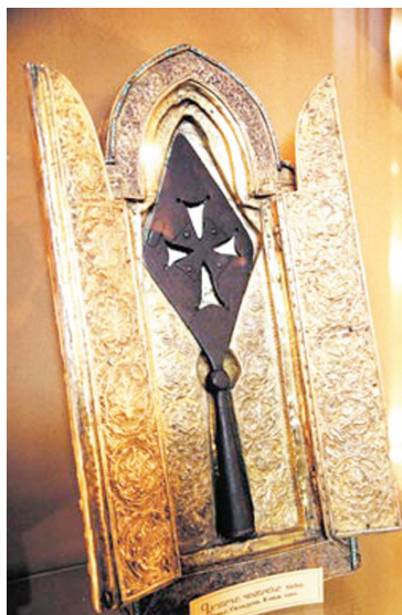
Копье сотника Лонгина

Но как отметил патриарх Московский и всея Руси Кирилл, «несмотря на то, что наши церкви в силу исторических причин не имеют евхаристического общения, мы отчетливо осознаем близость друг к другу. Причину тому мы находим в приверженности Русской православной и Армянской апостольской церквей древнему церковному Преданию. На его основе веками формировались традиционные ценно-