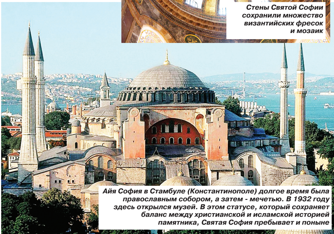
Айя София в Стамбуле (Константинополе) долгое время была православным собором, а затем - мечетью. В 1932 году здесь открылся музей. В этом статусе, который сохраняет баланс между христианской и исламской историей памятника, Святая София пребывает и поныне

Храм был построен в 324-337 годах при византийском императоре Константине I, не-