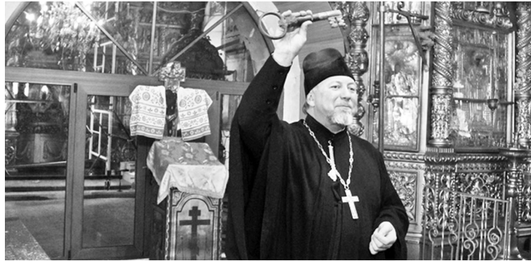
Старинный ключ, найденный в ограде руинированного Никольского храма села Николо-Ширь Парфеньевского района, передан в музей ИППО

В минувшее воскресенье, 17 мая, в Никольском храме села Саметь Костромского района, в рамках мероприятий Романовского фестиваля, сразу после Божественной литургии состоялось открытие музея Костромского отделения Императорского православного палестинского общества.